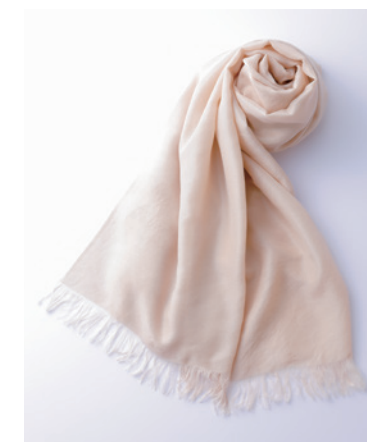
商品名: 和しるく・幸 サイズ: w860mm×h1800mm 素材: カシミア55%、シルク45%

今回のストールでは、経糸にシルク、緯糸にシルクとカシミアの合わせ糸を使用しました。カシミアを合わせることで、柔らかさや温もりの向上を目指しました。「ぬれよこ」製法により、水が糸同士を繋ぎ合わせ、お互いの長所をバランスよく引き出しています。その結果、滑らかで柔らかい肌触り、艶やかで温もりのある光沢、薄さと丈夫さを兼ね揃えた生地に仕上げることができました。さらに、染色には、植物など天然素材の色素を用いた「草木染め」を採用しています。自然素材ならではの見た目のやさしさや、世界に一枚しかない膨らみのある色合いを楽しんでもらいたいです。