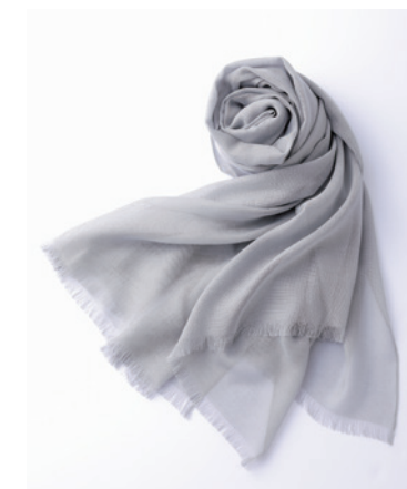
商品名: Refreshing Ieno サイズ: w1080mm×h2040mm 素材: カシミア35%、シルク65%

通常、織布用にはニットよりも太めの糸を使用するところを、グレードの高いニット用の極細の糸を使っています。「カラミ織り」は、緯糸にテンションが掛かり切れやすくなるため、卓越した技術と繊細な作業が求められます。染色は京都の西陣、風合い加工は一宮、縫製は横浜。それぞれ日本最高の技術を持つ職人の手によって仕上げています。