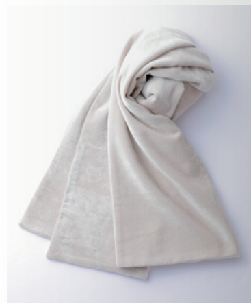
商品名: COMFORT VELVET サイズ: w500mm×h1800mm 素材: カシミア45%、シルク40%、コットン15%

「パイル」にシルクを使うことで障壁もありました。自然素材であるシルクには微細な節や太さのムラがあり、織る際に生じる引っかかりの解消や、繊細なカット作業が求められます。何度も検証を繰り返してできあがった、類を見ない商品を是非身に付けて堪能してほしいと思います。